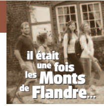
il était une fois les Monts de Flandre...

Comité Départemental du Tourisme 6, rue Gauthier de Châtillon - BP 1232 - 59013 LILLE Cedex - 03.20.57.59.59 En 2010, retrouvez toutes les infos sur les randonnées dans le Nord sur le site : www.rando-nord.fr Pour des informations générales sur le tourisme : www.tourisme-nord.fr