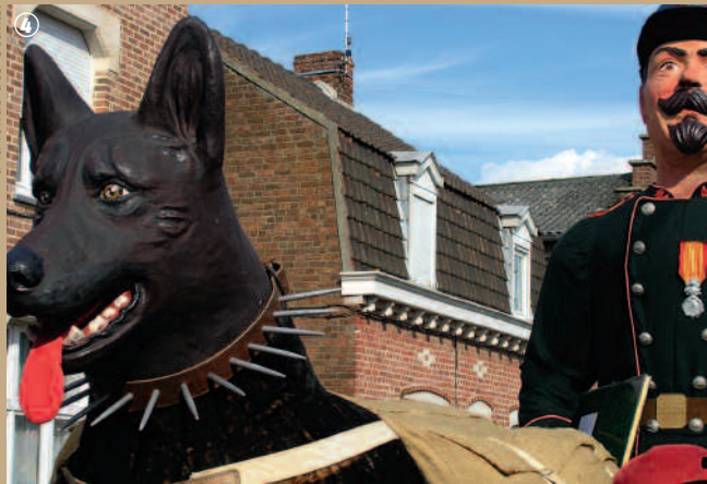
Henri le Douanier et Tom le chien du fraudeur à la ronde des Géants.