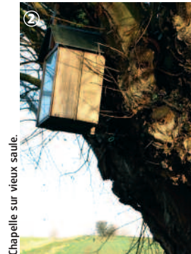
Chapelle sur vieux saule.

Faites une halte dans un « café rando » Liste et infos sur : www.tourisme-nord.fr