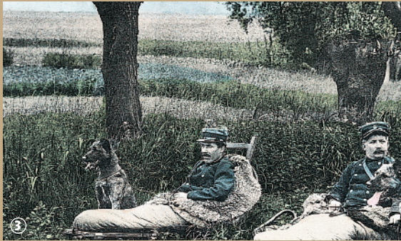
Douaniers dans leur lit de camp.

La fraude, une bien étrange activité, qui fait la renommée du village de Godewaersvelde. Vers les années 1850, quand les frontières économiques existaient encore, de nombreux Flamands pratiquaient le libre-échange à leur manière : ils empruntaient les chemins de traverse les poches pleines de tabac de contrebande. Quelle aventure ! Que de subterfuges imaginés pour éviter les douaniers ! Car eux aussi étaient de la partie. Munis d'un sac de couchage en peau de mouton sur le dos et d'un lit pliant appelé pour l'occasion lit d'embuscade, ils veillaient la nuit à l'affût des contrebandiers. Depuis 1994, un géant rend hommage à ces « empêcheurs de tourner en rond ». Il s'appelle Henri le douanier de Godewaersvelde, en souvenir de l'ancien douanier Henri Dupont. Haut de 3,80 m pour