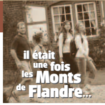
il était une fois les Monts de Flandre...