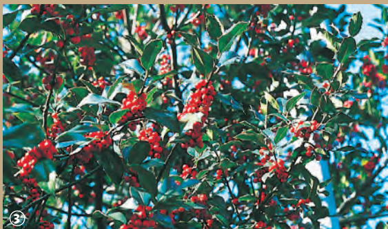
Houx en panure rouge.

La Flandre ne se réduit pas au plat pays ou, par opposition, aux Monts de Flandre. Elle est parfois désignée, notamment dans la région de Wormhout, sous le qualificatif d'Houtland. Bizarrement, ce n'est