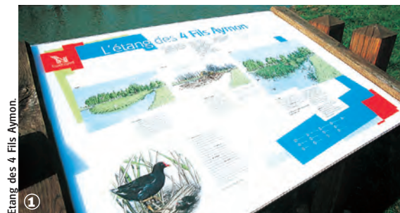
Etang des 4 Fils Aymon.