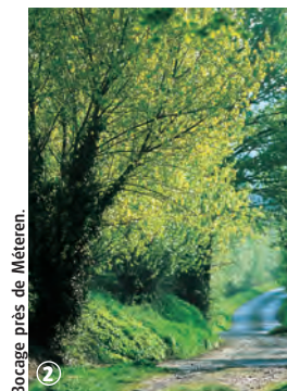
Bocage près de Méteren.